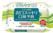
口腔清拭シート リフレケアU