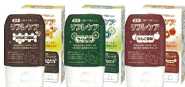
薬用 口腔ケア用ジェル リフレケア

口腔ケアにおいて、容易に進まず、仕方がないと諦めた経験はありませんか?口腔ケアのコツを習得すると、今まで諦めていたことが円滑に進められるようになり、明日からの口腔ケアが変わるかもしれません。本セミナーでは、口腔ケアを効率よく進められるコツについて、よくあるケースと共に動画や写真等を交えて解説しております。 ぜひ、この機会に口腔ケアのコツを習得して頂き、口腔ケアの効率化やスキルアップに繋げて頂ければと思います。