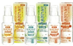
薬用 口腔ケア用ジェル リフレケア